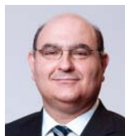
GABRIEL BERNARDINO Presidente da Autoridade Europeia dos Seguros e Pensões Complementares de Reforma (EIOPA); Universidade Nova de Lisboa; Instituto de Seguros de Portugal.